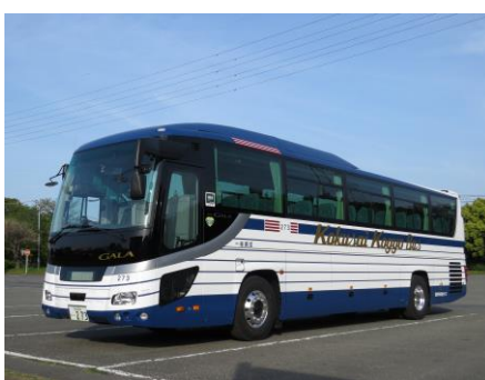
国際興業観光バス