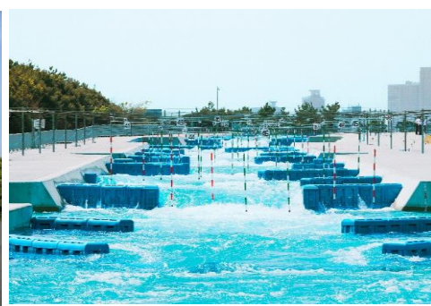
カヌー・スラロームセンター

国際興業株式会社（本社：東京都中央区 社長：南正人）は、東京都旅行支援事業「ただいま東京プラス」対象商品として、日帰りバスツアー「東京スポーツレガシー『国立競技場スタジアム見学』・『カヌー・スラロームセンター特別ガイド付きツアー』」を2月24日より販売を開始いたしました。