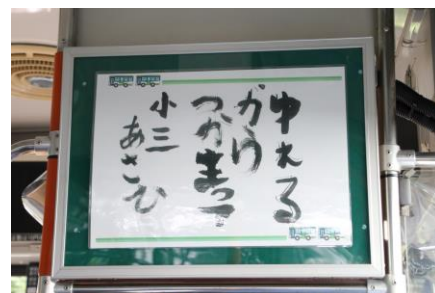
乗務員子女が作成した標語